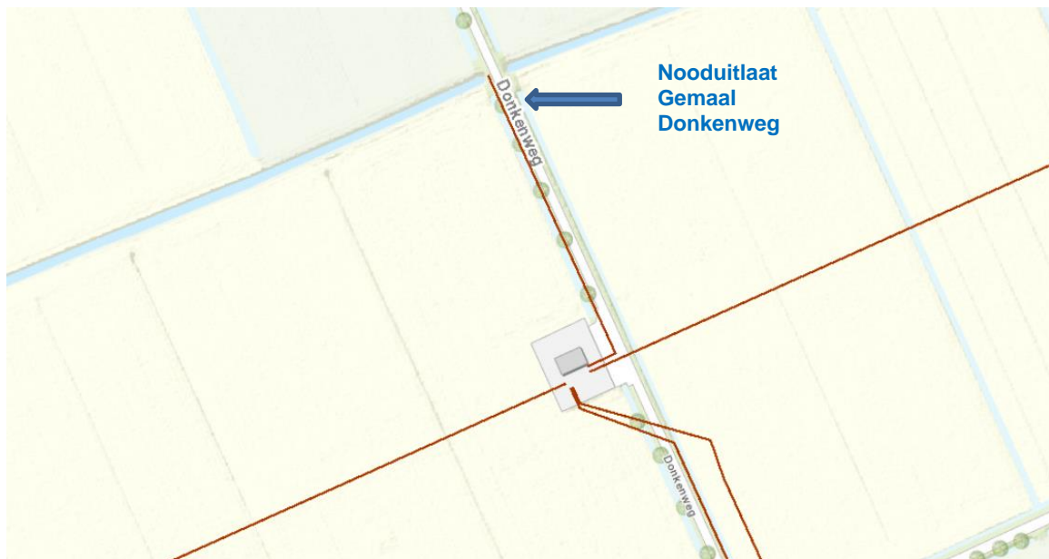
Detail locatie nooduitlaat Donkenweg, overstort vanuit RG Donkenweg naar de waterloop langs de Kerkdijk richting de Hoefgraaf.