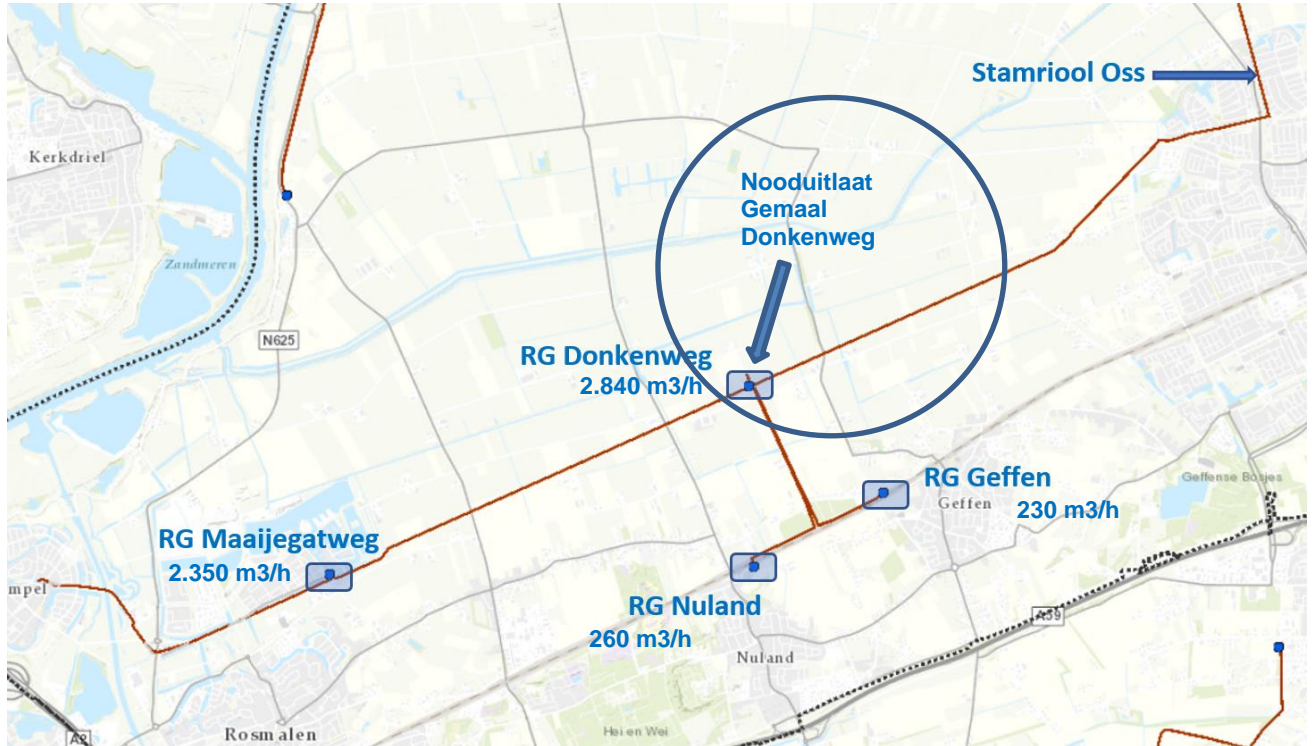
Geografische ligging van de gemalen