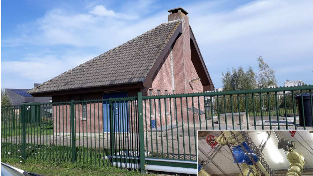
Behuizing (achtergrond: de Grootte Wielen)