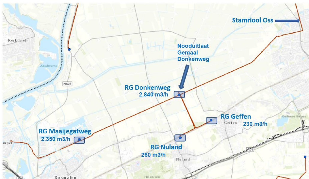
Geografische ligging transportsysteem

Een volgende renovatie was in 2015 nodig om dit probleem op te lossen, maar was onwenselijk omdat de pompinstallaties van de gemalen nog niet economisch waren afgeschreven. Om de investering uit te kunnen stellen zijn op beide gemalen slimme technische aanpassingen gedaan. Dit met als resultaat een reductie van het aantal verstoppingen naar ca 25x per jaar per gemaal. Hierdoor is het gelukt de technische levensduur te rekken met 2 à 3 jaar tot het moment dat de installaties helemaal zijn afgeschreven. Gezien de integraliteit wordt het kleine gemaal Nuland meegenomen in dit project, het gemaal loost op hetzelfde transportsysteem. Zie onderstaande afbeelding voor de geografische ligging.